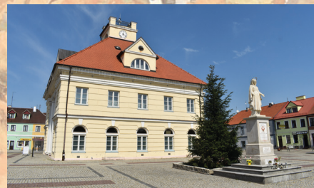
Ratusz w Łęczycy