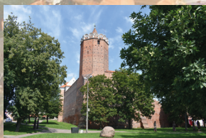
Zamek w Łęczycy