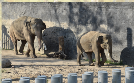
Orientarium w Łodzi