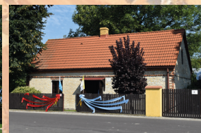
Dom Faustyny Kowalskiej w Głogowcu