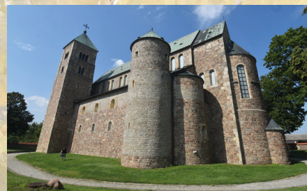
Kolegiata w Tumi