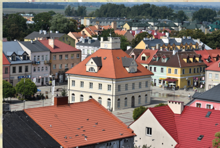
Widok z Zamku w Łęczycy