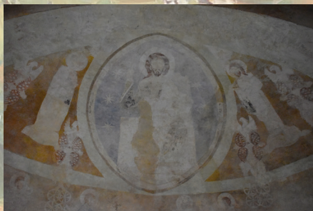
Polichromia w Kolegiacie w Tumi