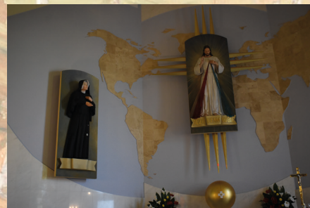
Kościół w Świniach Warckich