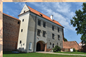
Zamek w Łęczycy