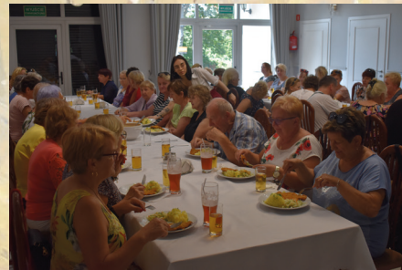
Obiad w Łęczycy