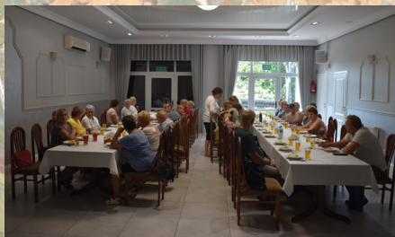
Obiad w Łęczycy